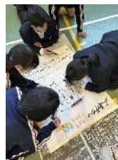
アイデアのつくり方