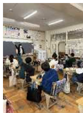
お金の大切さを学ぶ