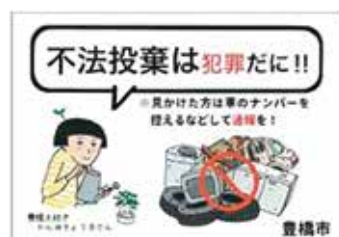
防止啓発パネルの一例