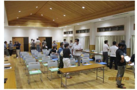
各作業部会にて、部会長と副部会長が決まりました！