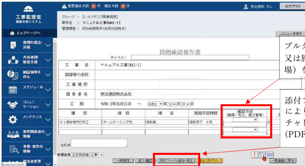
図-1 画像データ (例)