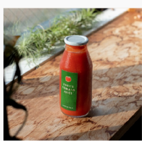
規格外品を活用した豊橋産フルーツトマトジュースの開発