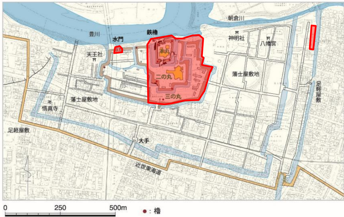
史跡吉田城址の指定範囲（全体）