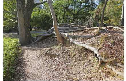
遺構保存のための整備を行う候補地の例