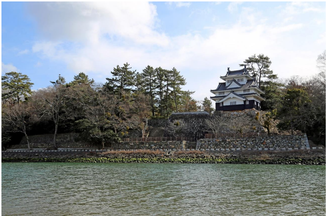
史跡吉田城址を代表する歴史的景観 (豊川対岸から望む本丸石垣と復興鉄橋)