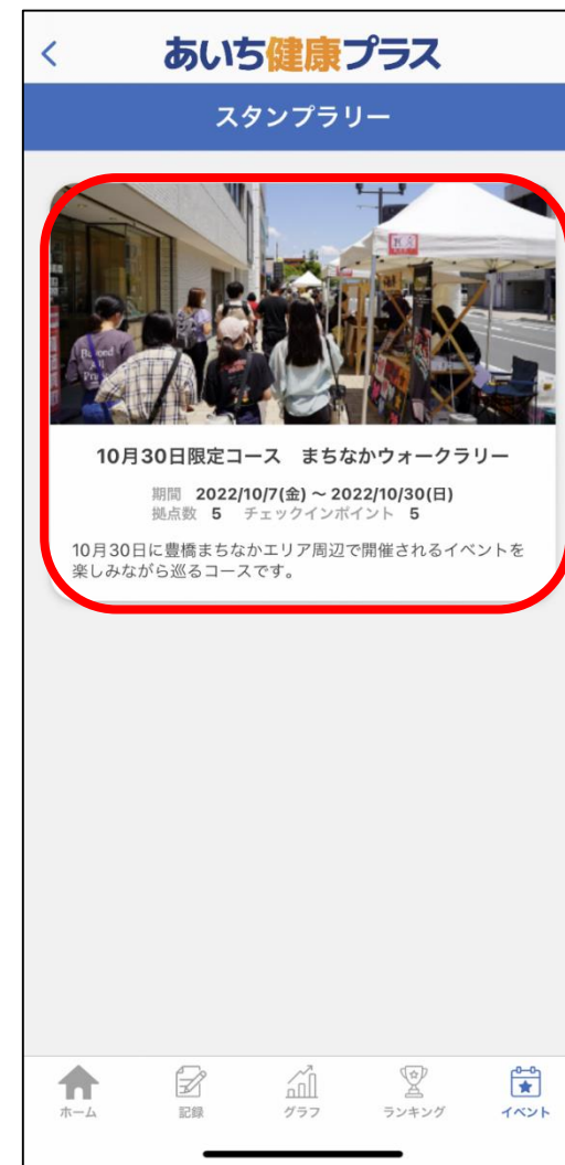
③ 指定のコースをタップ ※画像のコースは一例です。