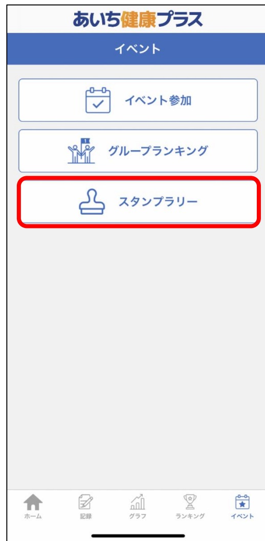
② スタンプラリーをタップ