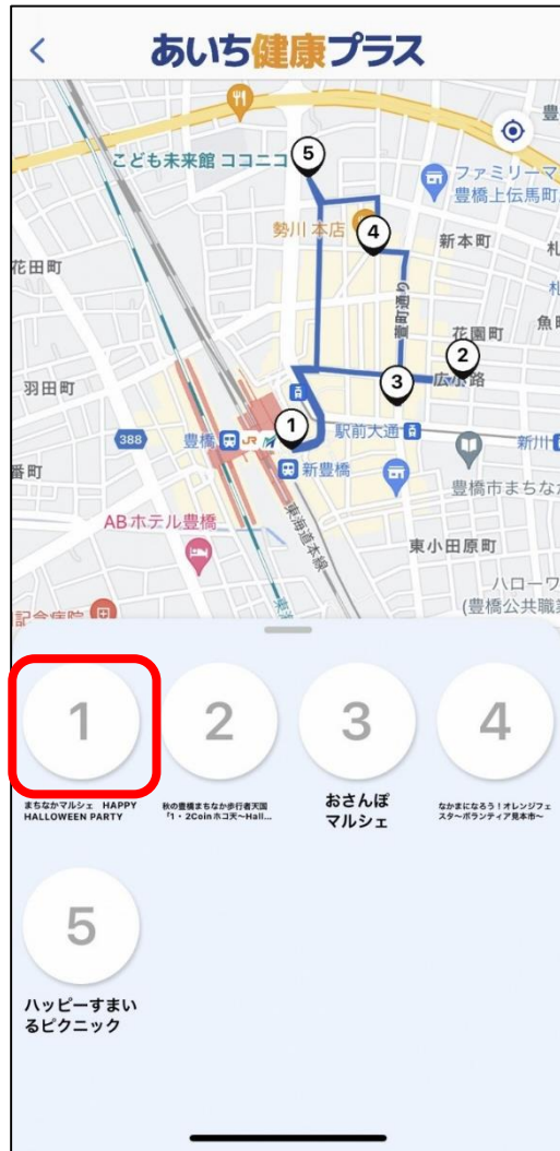
④チェックポイントをタップ