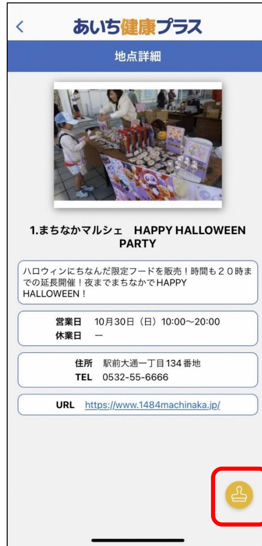
⑤チェックポイントに近づいたら スタンプマークをタップ