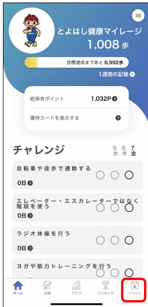
① イベントをタップ