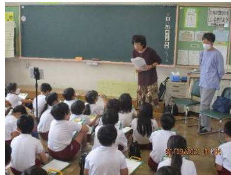
(3年 公園ボランティアの話を聞く会)