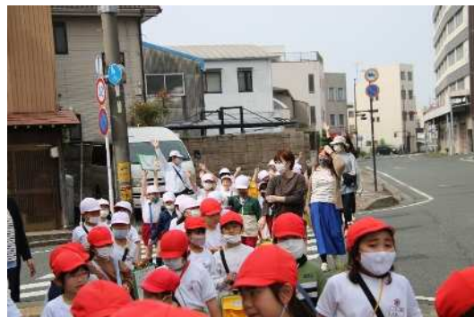
(2年 校区探検見守り)