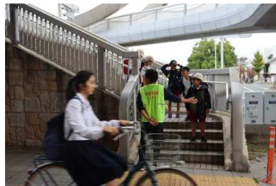
(通学路 歩道橋見守り)