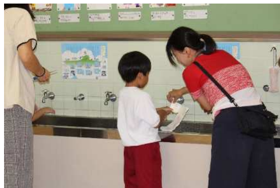
(牛乳パックの片づけ)