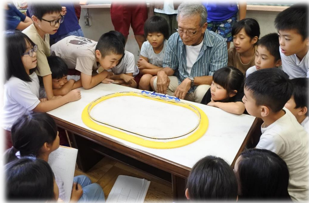
3年理科「リニアモーターカー(磁石)」