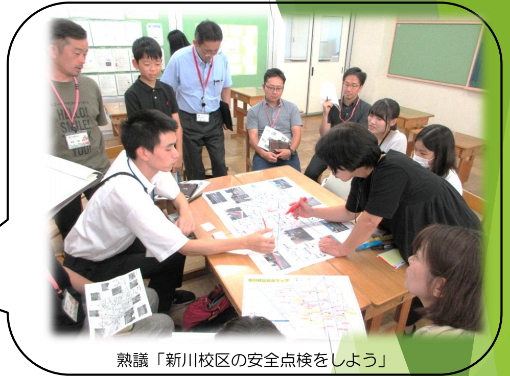
熟議「新川校区の安全点検をしよう」