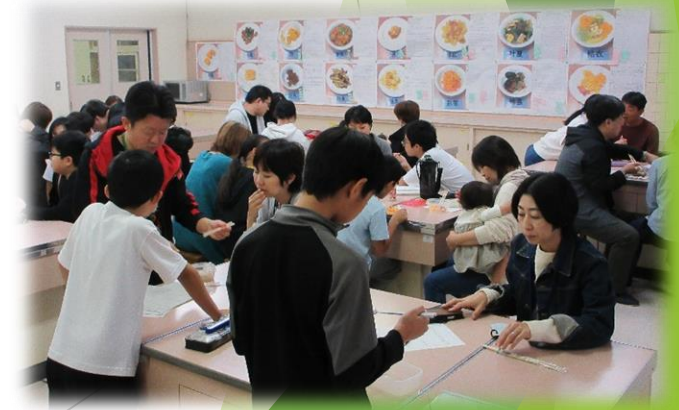
6年家庭科 「スペシャルメニュー作り」