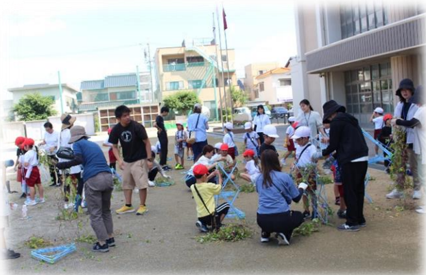
1年生活「アサガオリース作り」