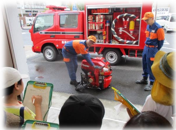
5年総合「防災(消防団)」