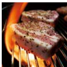
田原ポークステーキ