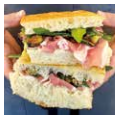
生ハムのパニーニ