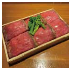
厳選赤身肉の肉寿司