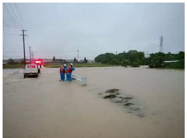
45 高師本郷町救助事案活動状況