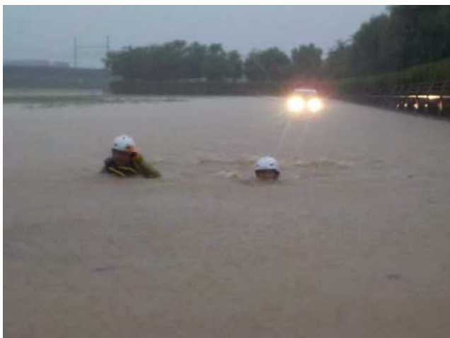
28 中原町救助事案活動状況