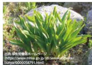
▲イヌサフランの葉