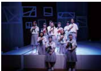
2023年度 高校生と創る演劇「101年目の夏休み」

対象: 平成18年4月2日~平成21年4月1日生まれで、公演日(11/2(土)~11/4(振休))に参加できる方(①は8月中旬のワークショップと9月からの稽古に参加が必要) 定員: ①15人程度 ②若干名 審査: 5/18(土)、5/19(日)のいずれかと5/26(日)に演劇のワークショップを実施 申込み: 4/26(金)17:00(必着)までに申込書を穂の国とよはし芸術劇場(〒440-0887西小田原町123) ※申込書は「文化のまち」づくり課、穂の国とよはし芸術劇場ほかで配布。プラットホームページからも申し込み可 問合せ: 穂の国とよはし芸術劇場(☎39・8810)