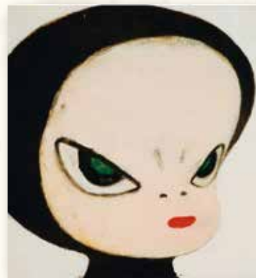
奈良美智「黒頭巾」1996年

鋭いまなざしを向ける子どもを描いた奈良美智の作品「黒頭巾」をはじめ、昨年度に個人コレクターから寄贈された現代美術作品を展示します。当館では初収蔵の作家による作品が鑑賞できますので、ぜひお越しください。