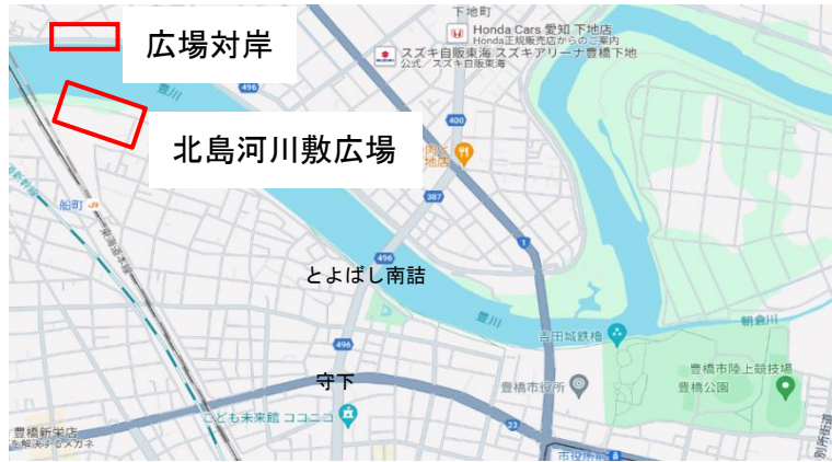
北島河川敷広場（浸水地域からの救助訓練）／ 広場対岸（排水活動訓練）