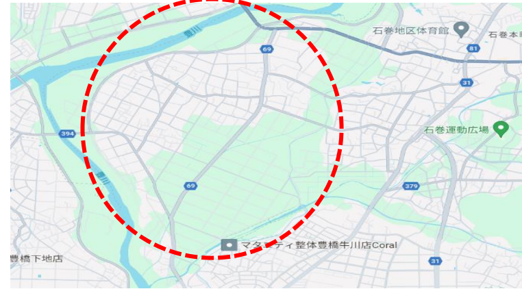
下条霞堤地区（道路通行止訓練）