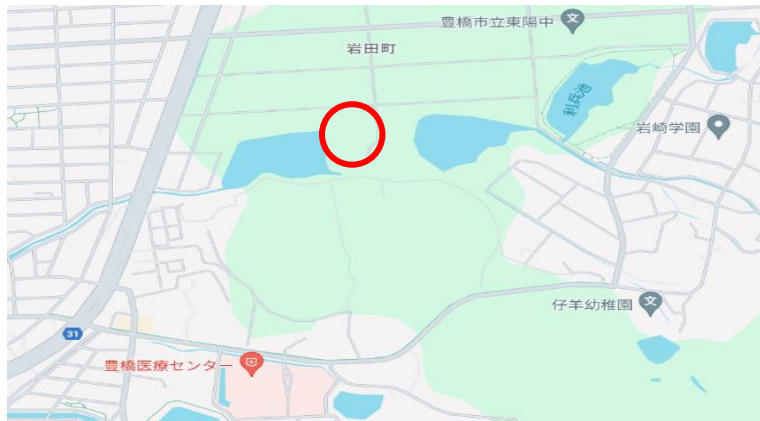
豊橋市消防総合訓練場（水没車両救助訓練）