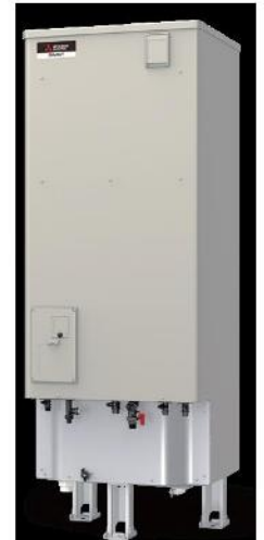
自然冷媒ヒートポンプ給湯機 エコキュート

現在の住宅事情は、土地価格の高騰、建築資材の高騰に加え、働き方改革に伴う人件費の増加、原油価格上昇に伴う輸送コストの増加など、販売価格に反映せざるを得ない要因が数多く存在しております。