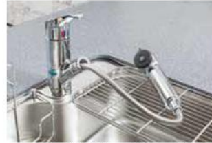
浄水器付ハンドシャワー混合水栓

価値あるものを、よりリーズナブルに。暮らしの文化の頼れるパートナーとして、豊かな社会環境を創造しています。