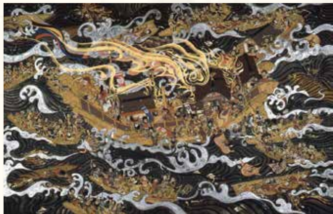
《源平海戦絵巻第3回「玉楼炎上」》1964年 (東京国立近代美術館蔵) ※3/11(火)~3/30(日)に展示