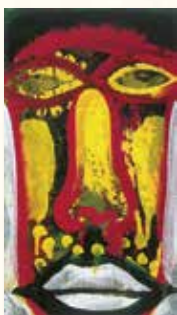
中村正義《顔》 1973-76年 中村正義の美術館蔵