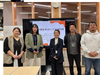
講師とアシスタントの皆さん