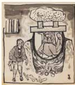
星野真吾『郷土の伝説』より《山ウバのはなし》