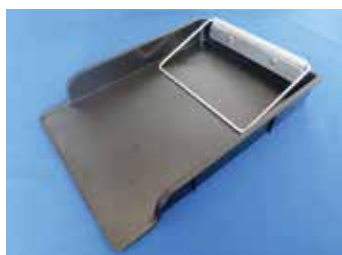
ペーパーホルダージグ