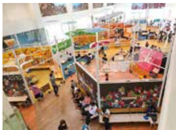
リニューアル前のようす