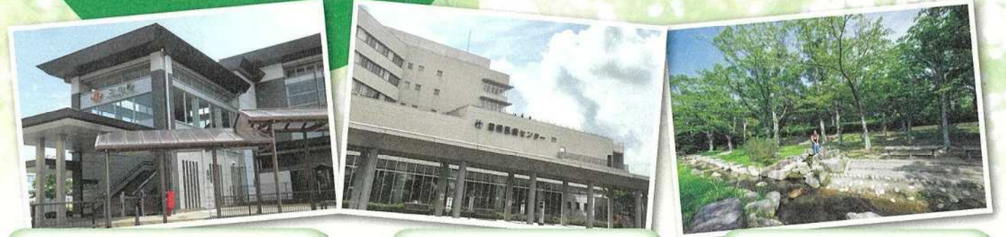
ヤマナカニ川店／二川駅 ●●● 豊橋医療センター ●●● 運動公園