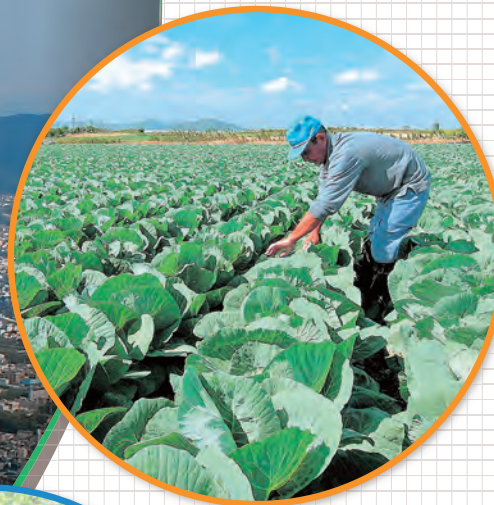
全国トップクラスの農業 ● とよはし食文化