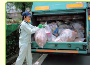
清掃作業員 (業務課)