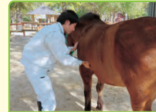
獣医師 (動植物公園、保健所)