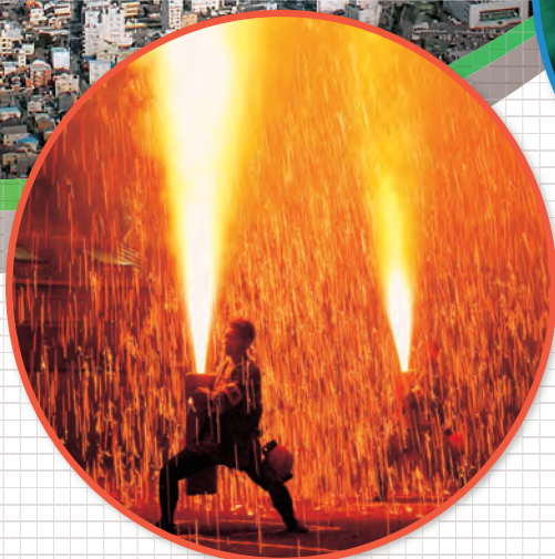
手筒花火の放揚 ● 手筒花火