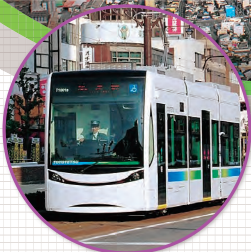
全面低床車両「ほつらム」 ● 路面電車