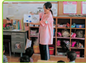
保育士 (保育課など)