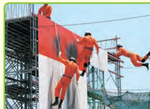
消防職 (消防本部・消防署)