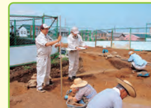
学芸員 (自然史博物館、美術博物館、科学教育センターなど)