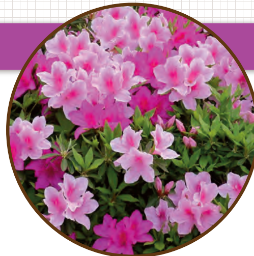
豊橋市の花 ●つつじ