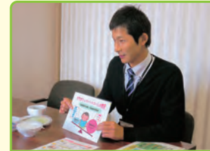
保健師 (保健所、国保年金課など)