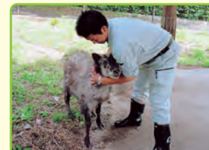
動物飼育員 (動植物公園)