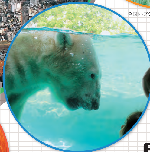
ホッキョクグマのダイビング ● のんほいパーク