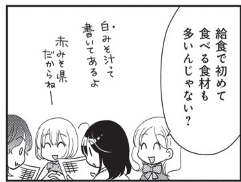
漫画「だもんで豊橋が好きって言っとるじゃん!」 ©佐野妙/竹書房

12月に提供するカレーライス、すき焼き、ねぎみそ丼、肉じゃが、豚汁などの調理風景の動画を掲載中!ぜひご覧ください!