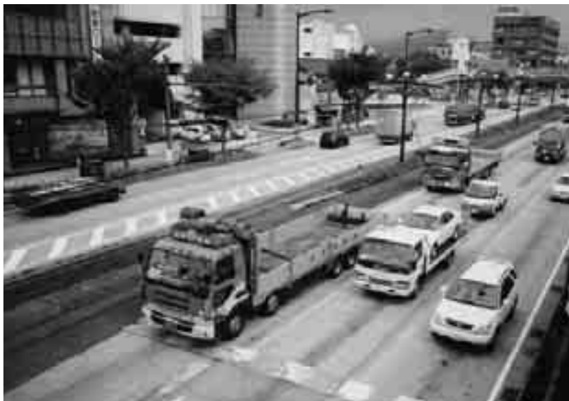
自動車交通の状況

本市は、騒音規制法、振動規制法、悪臭防止法及び県民の生活環境の保全等に関する条例の規定に基づき、関係工場等の監視・指導、環境騒音調査並びに国道1号などの自動車騒音・道路交通振動調査等を実施した。