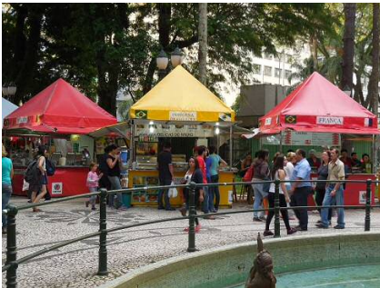
クリスマスの屋台が並ぶ広場

それでは第29問。今ブラジルはクリスマスのイルミネーションが輝き、たくさんの屋台が出て街は賑やかです。クリチバ市に来て、早速屋台の見物に行ったのですが、そこで興味をそそるサンドイッチ(バーガー?)に出会いました。ここで問題。そのサンドイッチは日本人が好みそうな味で、私は毎日食べました。そのサンドイッチとはどんなものでしょう？