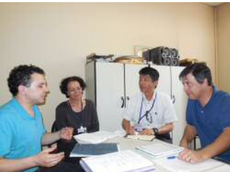
心理学部と打合せ