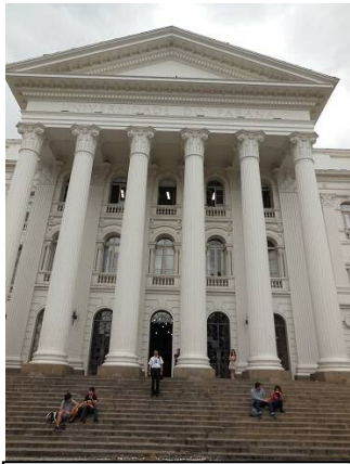
パラナ連邦大学本校舎

なかなか具体的な政策として進まない「帰国者支援プロジェクト」ですが、実現に向けて連日 関係機関と打合せを行いました。今回はパラナ連邦大学の心理学部教授にも同席していただき、心理的サポートの方法やプロジェクトの具体案についてご教示いただき、下図のような具体案がまとまりました。来年よりプロジェクトが始動することを期待します。