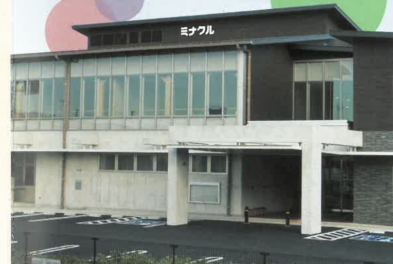
豊橋市大清水まなび交流館