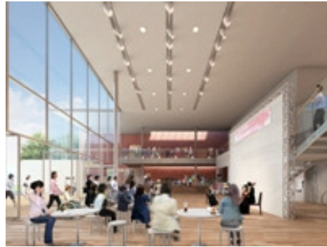
穂の国とよはし芸術劇場（プラット）