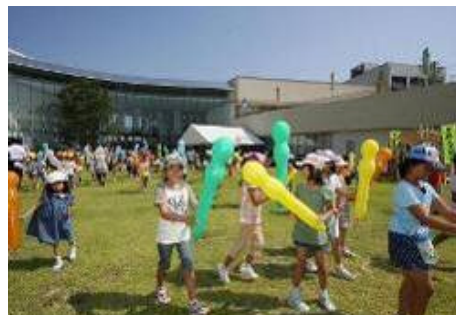
多世代交流施設 こども未来館（ここにこ）