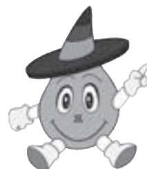
上下水道局マスコット「クリン」

[共通事項] 問い合わせ: 上下水道局お客さま料金センター (☎51・2712)