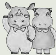
豊橋サイエンスコア (無料シャトルバス発着場所)

■無料シャトルバスを運行します 豊橋サイエンスコア(西幸町字浜池)臨時駐車場へののんほいパーク西門前 とき 5月3日(祝)～6日(休)午前10時から運行(約15分間隔) その他 豊橋サイエンスコア臨時駐車場料金も無料です