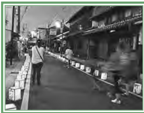
灯籠で飾ろう二川宿のようす

トヨッキー基金への寄附は、随時受け付けています。この基金への寄附は税金の優遇措置があります。詳しくは市民協働推進課 ☎51・2483 http://www.city.toyohashi.lg.jp/5230.htm