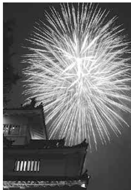
豊橋祇園祭打ち上げ花火

申し込み: 5月19日(消印有効)までに返信先明記の往復はがき(1枚で2人分の入場整理券)で住所、氏名、年齢、電話番号を豊橋祇園祭奉賛会入場整理券係(〒440-0891 関屋町2吉田神社内) 発表: 当選はがきの発送をもって発表とします 参加料: 1,000円(2人分) 入場整理券の受け渡し: 当選はがきに記載されている配布日時に奉賛会事務所にて、当選はがきと参加料を2人分の入場整理券に引き換えます。18日午後6時30分までに入場できないときは入場をお断りする場合があります 問い合わせ: 豊橋祇園祭奉賛会(☎53・5528)、豊橋観光コンベンション協会(☎54・1484)、市役所観光振興課(☎51・2430)