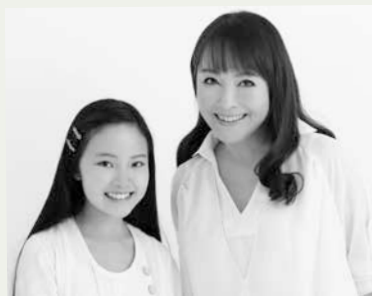
井上あずみ&ゆーゆ

10月初旬に開催予定の40周年記念式典の開催にあわせ、「となりのトトロ」の主題歌でおなじみの、井上あずみさんと愛娘ゆーゆーさんのコンサート、記念植樹を行います。詳細は決まり次第、本紙などでお知らせします。