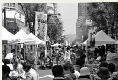
まちなか歩行者天国

尽くします。楽しく環境について学べる企画が盛りだくさんです。参加料 無料(一部有料イベントあり)