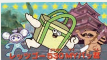
昨年度のコンテスト グランプリ作品「MY バックんのうた」

530運動やエコ活動を全国に広げるため、昨年度に引き続き、環境映像コンテストを開催します（詳細は本紙6月1日号に掲載予定）。あなたの想いを作品に込めて、見た人の環境に対する考えや行動を変えてみませんか？昨年度の受賞作品はホームページ（ http://www.530.toyohashi.aichi.jp/contest/ ）または左記のQRコードから視聴できます。