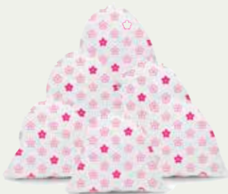
ごみステーションに つつじの花が咲きます