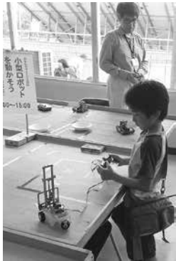
おもしろサイエンスの日のようす

とき: 5月24日(日)午後1時～3時(随時参加可) ところ: 視聴覚教育センター(大岩町字火打坂) 内容: サイエンス・ボランティアといっしょに、簡単な工作や科学あそびを体験します 参加料: 無料 申し込み: 不要 問い合わせ: 地下資源館(☎41・2833)