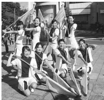
ホワイトシーガールズ

募集人員: 5人(申込順) 対象: 18～30歳位までの明るく元気な女性で、フラッグ・バトン・ダンスなどに興味のある方※経験不問 活動内容: 豊橋まつりや消防出初式など各種行事に参加し、パレードやダンス・フラッグの演技を披露します その他: 衣装、フラッグなどは貸与します。毎週火・金曜日午後7時30分～9時30分に中消防署(東松山町)で練習を行います 申し込み: 随時、消防本部総務課(市役所西館5階 ☎51・3105)