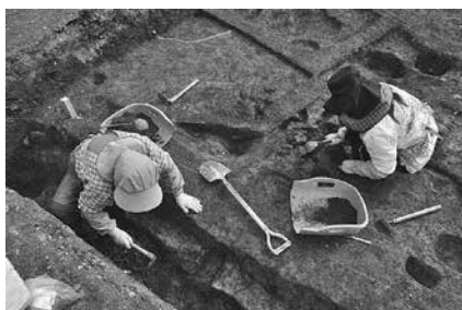
発掘作業のようす

人員/賃金: 若干名/時給990円 応募資格: 市内在住の健康な方(高校生を除く) 雇用期間: 6月～平成28年3月まで(2か月を越える連続雇用はありません) 勤務内容: 牟呂坂津または牛川西部土地区画整理事業他に伴う発掘作業 勤務地: 牟呂町または牛川町の発掘現場 その他: 申し込み時に面接あり 申し込み: 5月27日午前10時または午後2時に写真貼付の自筆の履歴書と筆記用具を直接、文化財センター(松葉町三丁目) 問い合わせ: 文化財センター(☎56・6060)