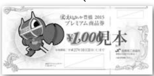
子育て支援プレミアム商品券

子育て支援プレミアム商品券の購入券を対象世帯に7月初旬に発送します。7月13日(月)～24日(金)土・日曜日、祝日を除くは市内郵便局(簡易郵便局を除く)で、7月27日(月)～8月31日(月)土・日曜日を除くは市役所こども未来政策課(西館3階)で購入できます。詳細はホームページ( http://www.city.toyohashi.jp/18661.htm ) または本紙5月1日号4ページをご覧ください。