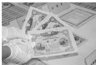
引揚者からお預りした通貨・証券など

返還している通貨・証券など: 上陸地の税関または海運局に預けられた通貨・証券など、および帰国前に在外公館や日本人自治会などに預けられた通貨・証券などのうち、その後日本に返還されたもの その他: 詳細は名古屋税関ホームページ ( http://www.customs.go.jp/nagoya/ ) 参照 問い合わせ: 豊橋税関支署 (☎32・6566)、財務省名古屋税関監視部監視通関部門 (☎052・654・4060)