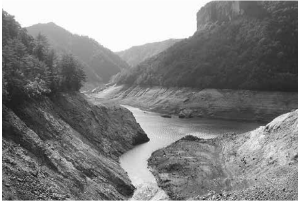
渇水時の宇連ダム

そのひとつの「水源林保全流域協働事業」は水道料金の一部(1tにつき1円相当額)を原資とするもので、間伐に加え、広葉樹の植樹による人の手のかけりにくい森林づくり、水源林の保全を行う人材の育成などに取り組んでいます。