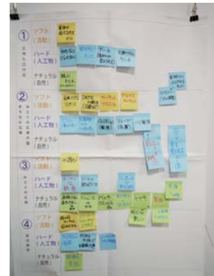
集まった意見を班ごとにまとめます