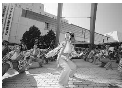
元気あふれる演舞部門

会場 豊橋公園、こども未来館ここに、駅前口サークルプラザ、駅南口駅前広場、広小路通り