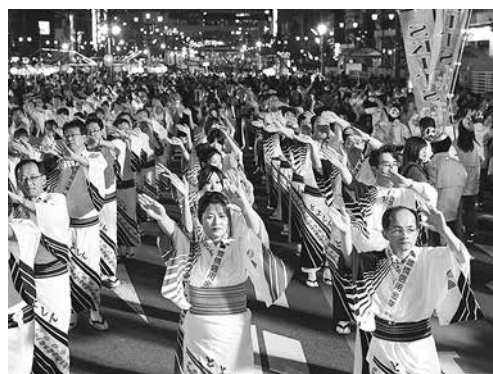
昨年の総おどりのようす