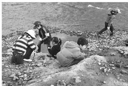
化石採集のようす

とき: 11月22日(日)午前8時45分～午後4時30分 ところ: 岐阜県瑞浪市 集合・解散: 豊橋市自然史博物館※バス使用 対象: どなたでも(小学生以下は保護者同伴) 内容: 1,600万年前のサメや貝の化石などを掘り当てます。雨天時は瑞浪市化石博物館で特別講義を聞きます 講師: 当館学芸員 定員: 40人(抽選) 参加料: 1,000円 申し込み: 11月5日(必着)までに返信先明記の往復はがきで教室名、参加者全員の住所・氏名・年齢・電話番号を自然史博物館(〒441-3147大岩町字大穴1-238 ☎41・4747)