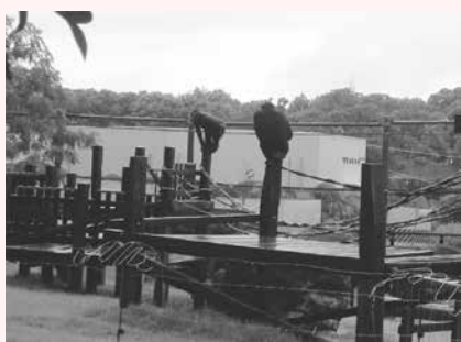
パタスザル舎を見つめるチンパンジー