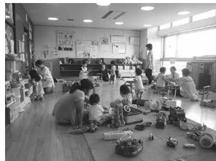
つどいの広場(イメージ)

とき: 10月6日(火)以降の毎週火・水・木 曜日（祝・休日、年末年始、アイプラザ 豊橋の貸切日などを除く）午前10時～午 後3時 ところ: アイプラザ豊橋（草間町 字東山） 対象: 0～3歳児の乳幼児と 保護者 内容: 親子で気軽に集える交流 広場です。子育てに関する情報提供や 講座の開催、育児相談なども行います 参加料: 無料 申し込み: 不要 問い合 わせ: こども未来政策課（☎51・2325）、 とよはしファミリー・サポート・センター 事務局（あいトピア内☎56・7500）