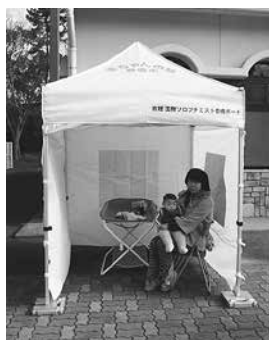
移動式赤ちゃんの駅

対象: 市内で乳幼児を連れた保護者が参加できるイベント(特定の政治、思想、宗教、営利を目的とするものを除く)を主催する団体 貸出備品: テント1張、おむつ交換台1台、椅子2脚 貸出期間: イベントの実施期間に前後1日を加えた期間 貸出料: 無料 申し込み: 随時、申込書を市役所こども未来政策課(西館3階)※申込書はホームページ( http://www.city.toyohashi.lg.jp/22839.htm )で配布