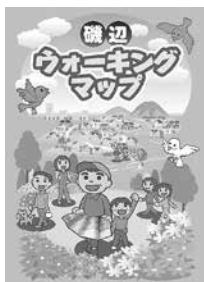
豊橋いきいき健康マップ(一部)

とき: 10月19日(月)～23日(金)午前8時30分～午後5時15分 ところ: 市役所市民ギャラリー(東館1階) 内容: 各校区の住民と身近でウォーキングに適した場所を選定し作成したマップなどを展示します 問い合わせ: 健康増進課 (☎39・9145)