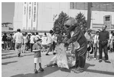
豊橋市環境部マスコット「そうじろう」とアートごみ袋

とき: 11月7日(土)~16日(月) 内容: 530運動40周年を記念して作成した、つつじ柄の「530アートごみ袋」を使用して、市内一斉の清掃活動を実施します。各個人、町自治会、団体、事業所などで行ってください その他: 事前に計画書を提出した場合は、ごみ袋を差し上げます※計画書は市役所環境政策課(西館5階)で配布 問い合わせ: 530運動環境協議会事務局(環境政策課内☎51・2414)