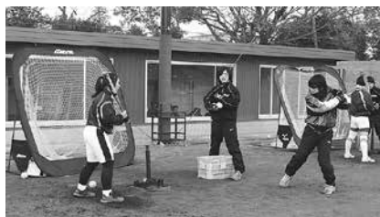
ソフトボール講習会のようす

とき: 12月5日(土)午前9時～午後3時 ところ: 豊橋球場(豊橋公園内) 対象: 女子中学・高校生(ソフトボール未経験者も可) 内容: 日本女子ソフトボールリーグ豊橋大会で熱戦を繰り上げたデンソー女子チームの選手たちが、技術指導講習会を開催します。日本代表チームのメンバーも参加します 定員: 200人(申込順) 参加料: 無料 持ち物: バット、グローブ、ボール、昼食 申し込み: 11月13日までに氏名、年齢、電話番号、学校名を豊橋市体育協会(☎63・3031)