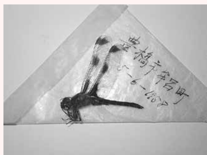
豊橋から姿を消したベッコウトンボ

自然史博物館で、11月14日(土)〜12月6日(日)に開催する企画展「日本のトンボ・愛知県のトンボ」では「消えたトンボ」たちの標本を紹介し、トンボからみた自然の変化の一端をお伝えできればと思います。