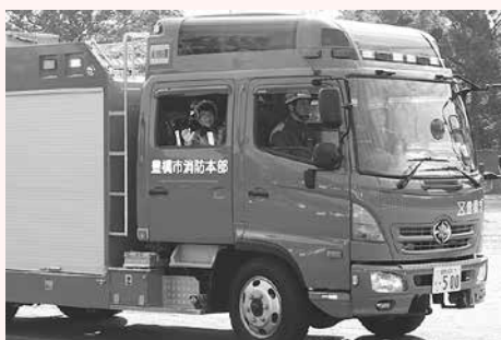
昨年の分列行進のようす

参加料 無料 その他 集合時間などの詳細は後日通知します 申し込み 11月4日〜16日(土・日曜日、祝・休日を除く)に消防本部総務課(☎51・3111)