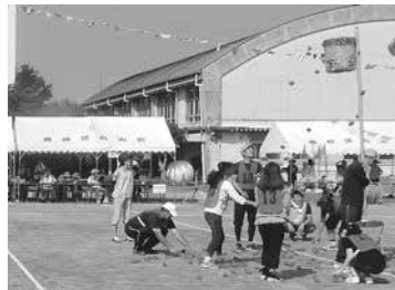
豊橋区に整備されたテント