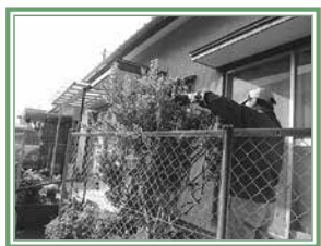
ボランティアによる庭木の枝切り

また、ボランティアは「あなたのできる時に、できることを。無理なく」を基本に活動しています。現在36人が登録していますが、常時募集していますので、ご協力いただける方はご連絡ください。 問い合わせ 岩田校区支え合い活動「のん・ほい」☎090・419961476