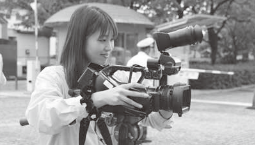
上下：市政情報番組「とよはしNOW」の収録風景。番組づくりにはみなさんの協力が不可欠。取材班を見かけたら素敵な笑顔をお願いします。