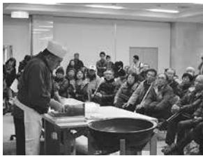
名人によるそば打ち実演