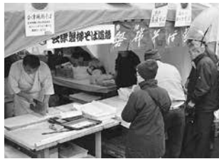
そばの味くらべ広場