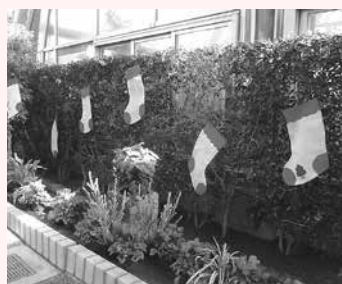
昨年の温室装飾のようす

この時期、植物園の温室でも多くのシクラメンが装飾に使われています。「シクラメンのかほり」をぜひ確認してみてください。