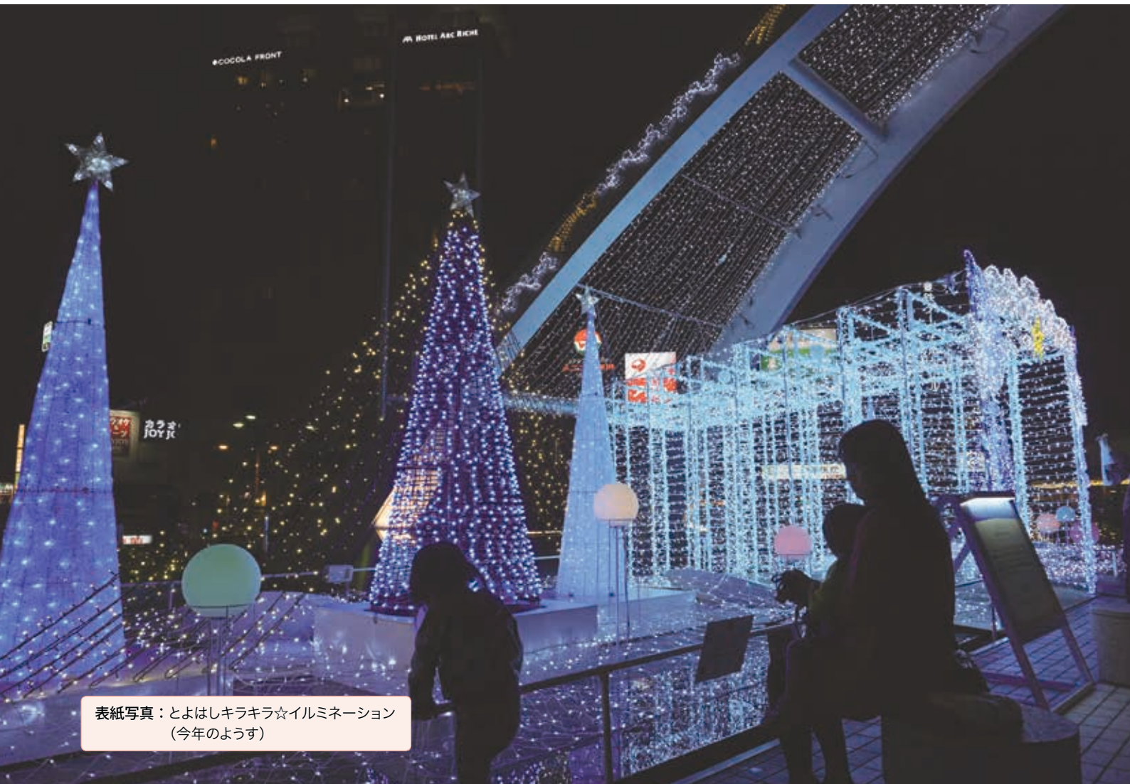
表紙写真：とよはしキラキラ☆イルミネーション (今年のようす)