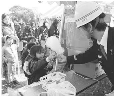
子どもたちに親しまれる地域のヒーロー