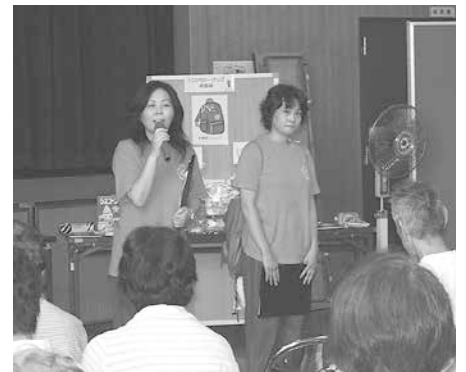
女性消防団員も活躍