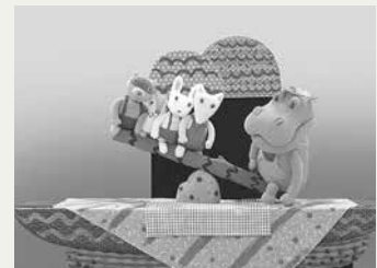
はつくしよんしてよかばくん

申し込み:12月31日(必着)までに返信先明記の往復はがきで①番号・講座名(1通に1つ)②とき③参加者全員の氏名・学年(年齢)④代表者の氏名・電話番号を、こども未来館(〒440-0897松葉町三丁目1)。またはホームページ(パソコン、携帯電話)内体験プログラム申し込みフォームより必要事項を入力