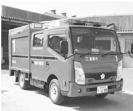
新型車両や救助資機材などの装備も充実

地域に貢献したい方はもちろん、家族や地域のみなさんを守りたいと思っている方、少しでも消防団に興味がある方は、地元の消防団または消防本部総務課にお問い合わせください。みなさんの入団をお待ちしています。 入団資格 市内在住・在勤の20歳以上50歳未満(女性団員は20歳以上55歳未満)で健康な方