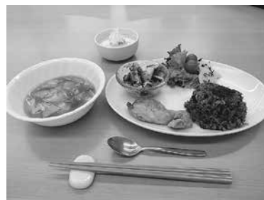
前回のメニュー(デリ風雑穀ランチ)

とき: 1月31日(日)午前10時30分～午後3時 ところ: 保健所・保健センター(中野町字中原「ほいっぶ」内) 対象: 市内在住・在勤の20～30歳代の男女(未婚・既婚は不問。カップルや夫婦での参加も可) 内容: 「妊娠前の身体作り」をテーマに、調理実習と試食を楽しみます。また、講演会では妊娠の適齢期と補助生殖医療、健康な親となるために必要な知識を学びます 講師: 上澤悦子さん(福井大学医学部教授) 定員: 36人(申込順) 参加料: 400円(材料費) ※講演会のみは無料 申し込み: 1月25日までに住所、氏名、年齢、電話番号を、こども保健課(☎39・9160☎38・0770) kodomohoken@city.toyohashi.lg.jp