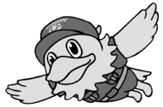
豊橋市消防団 マスコットキャラクター 「ワットくん」