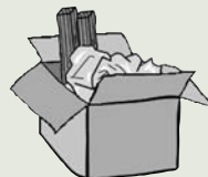
ダンボール箱でのごみ出し