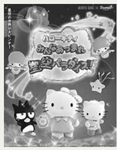
ハローキティ みんな集まれ星空パラダイス!

休園日 月曜日(月曜日が祝・休日の場合は翌平日)、12月29日、1月1日 参加料 無料(総合動植物公園入園料必要) 駐車料金 普通車200円、中・大型車400円 申し込み 不要