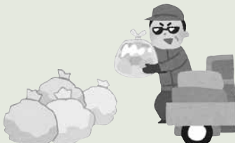
他の地域のごみステーションへのごみ出し

問い合わせ ごみの収集・ごみステーション/業務課(☎61・4136)、ごみ処理施設/資源化センター(☎46・5304)、埋立処分場(☎25・0145)、リサイクルステーション・古紙リサイクルヤード/環境政策課(☎51・2399)