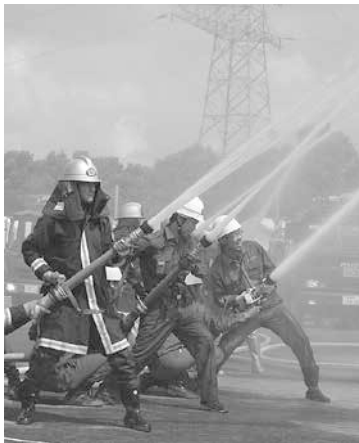
日々の訓練で災害に備えています

本市の消防団は、各校区に分団を配置し、市内全域を活動の場とする女性分団を加え、53分団1214人で構成されています。消防団員の職業は、サラリーマンや自営業、公務員、主婦、学生とさまざまで、年齢も20〜40歳代と幅広いため、消防団活動を通じて、異なる世代や業種の人とのつながりができるなど非常に有益な場です。