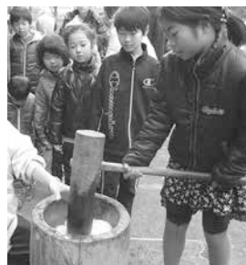
杵と臼を使ってもちをつくようす

とき: 1月9日(土)午前9時30分～11時30分 ところ: 民俗資料収蔵室(多米町字滝ノ谷) 対象: 市内在住の小学生と家族 内容: くどを使ってもち米を蒸し、杵と臼を使ってもちをつき、ひき臼できな粉を作ります。最後に作ったもちにきな粉をつけ試食します(持ち帰り可) 定員: 15組(1組4人まで。申込順) 参加料: 1人100円(材料費) 持ち物: 箸、皿(またはタッパ) その他: 公共交通機関をご利用ください 申し込み: