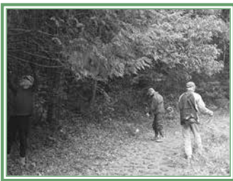
おもてなし活動・草刈り・枝打ちのようす