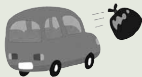
自動車越しのごみ出し