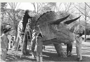
昨年の恐竜大掃除の様子

恐竜大掃除は、当職員だけでなく、博物館の登録ボランティアの方々にも協力していただき今年も12月17日(休)に行う予定です。年末年始は、1年の汚れを落とすきれいな恐竜たち、ぜひ会いに来てください。