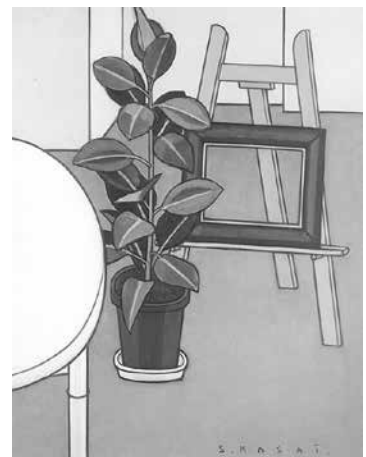
笠井誠一《室内(観葉植物のある)》 1986年

[共通事項] ところ: 美術博物館(豊橋公園内) 問い合わせ: 美術博物館(☎51・2882)