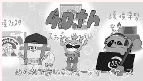
530運動40周年記念動画「530ラップ」( http://youtu.be/4VRcslgOcg )