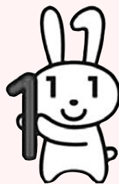
マイナンバー 広報用ロゴマーク 「マイナちゃん」

してほしい」といった詐欺にご注意ください。なお、人を欺く(あざむく)などして、他人のマイナンバーを取得することは法律により罰せられますが、不正な提供依頼を受けて自分のマイナンバーを他人に教えた場合は、刑事責任を問われることはありません